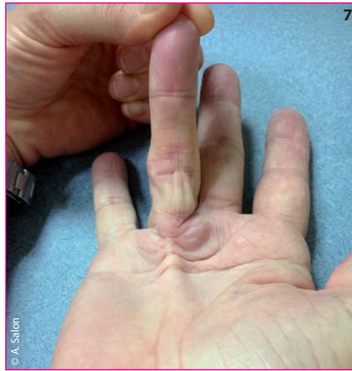
► Figures 5 à 7