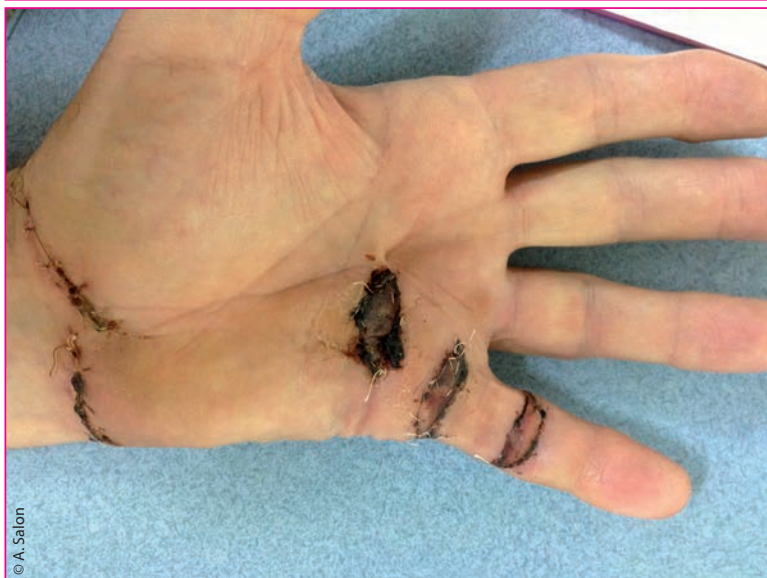
► Figures 8 et 9